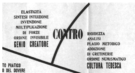
Рис. 4. Ф. Т. Маринетти, У. Боччони, К. Карра, Л. Руссоло, У. Пьянти, фрагмент из манифеста «Футуристический синтез войны» (1914).

и коммуникативной целью авангардной литературы. Любое утверждение должно быть подвергнуто отрицанию, высказывание должно «деавтоматизироваться», быть «остраненным» (в терминологии русских формалистов и В. Б. Шкловского), иначе оно перемещается в зону обыденного языка и автоматизируется, утрачивает новизну и действенность. Именно в этой установке на создание перформативного искусства, воздействующего на реальность, заложена политическая повестка авангарда, которая в своем радикальном воплощении получила форму взаимодействия с военным дискурсом. С целью интенсификации иллюкативной силы и деавтоматизации восприятия авангардисты осуществляют эксперимент с иллюкативно маркированными единицами. Идея тотального протеста выразилась в нарушении симметричного субъектно-объектного противопоставления взаимосвязанных элементов, которую в итальянском футуризме и русском авангарде заменили авторские формы протеста (бессубъектный, безобъектный, полимодальный), выражающие