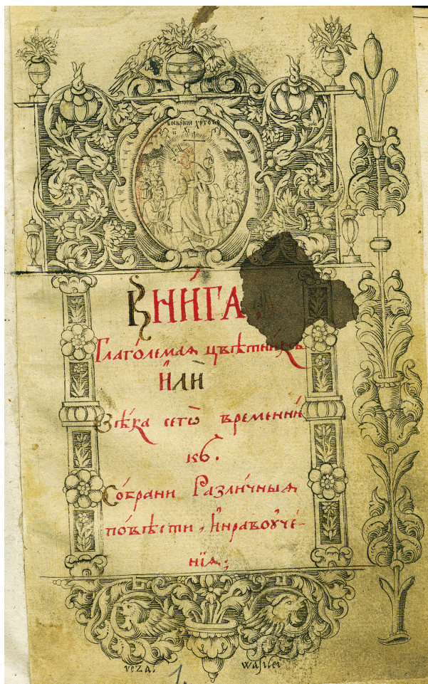
Рис. 1. Титульный лист рукописи «Книга, глаголема Цвѣтникъ...». РНБ, собрание М. П. Погодина, № 1396, л. 1